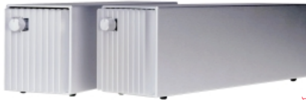
Crimson C640D silber

Mit den Monoblöcken CS640D ist Crimson ein wirklich grosser Wurf gelungen. Bei unveränderten Gehäuseabmessungen bieten die neuen CS640D wesentlich mehr Leistung und eine deutlich gesteigerte Auflösung und Dynamik gegenüber den „kleineren“ CS630D. In den CS640D arbeitet die grundsätzlich gleiche Schaltung mit kurzen Signalwegen wie in den anderen Crimson Verstärkern. Es werden jedoch statt des einen Paares extrem schneller bipolarer Ausgangstransistoren deren Zwei verwendet. So kann die Endstufe praktisch den doppelten Strom liefern der von einem entsprechend stark verbesserten Netzteil geliefert wird. Im Verstärkergehäuse untergebracht: zwei mächtige