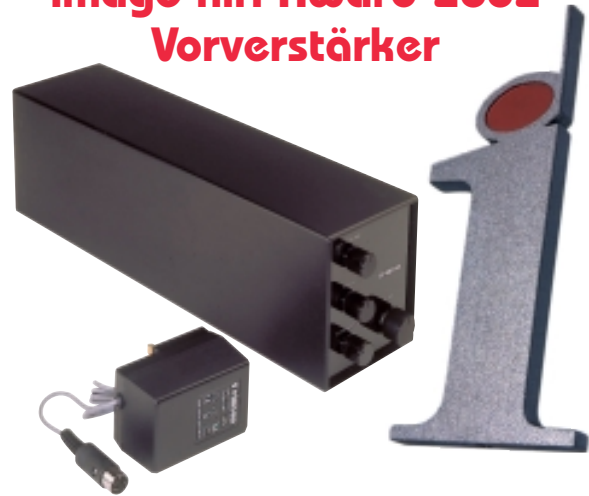
image hifi Award 2002 Vorverstärker

Besuchen Sie Crimson im Internet: http://www.audio-stereo.de